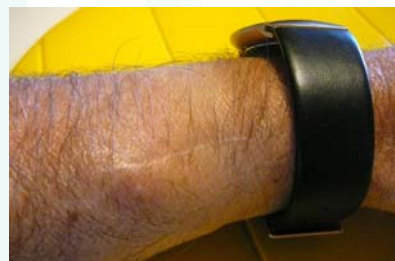
Bild 2: Shuntnarbe

Eine ausführliche Untersuchung vor dem Eingriff sollte vom Operateur persönlich vorgenommen werden. Hierbei sollte auch ein Konzept erstellt werden, welche Alternativen bestehen und welche Korrekturmöglichkeiten im Fall einer späteren Komplikation bestehen. Letztendlich sollte bei jedem Patienten ein persönliches Konzept für den Dialysezugang entstehen, in dessen Entstehung Nephrologe, Chirurg und eventuell auch ein Radiologe einbezogen sind.